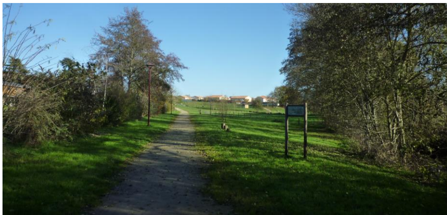
Cheminement doux à Jallais entre le cœur ancien et les extensions est du bourg

84 Dans le cadre d'une volonté nationale de réduction des émissions de gaz à effets de serres ainsi que pour pallier aux difficultés en déplacements de ceux qui n'ont pas accès à l'automobile, les cheminements doux doivent être traités pour une utilisation plus large que celle touristique.